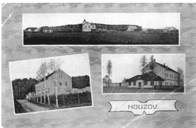
Restaurace a Nouzov na začátku 20. stol.