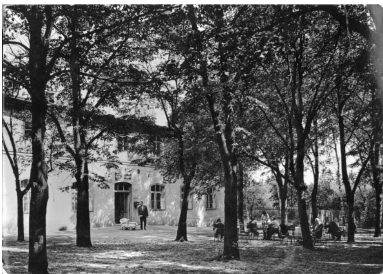
Restaurace okolo roku 1930