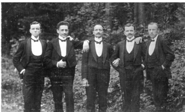
„Servíři“ restaurace U Spalů na poč. 20. stol.