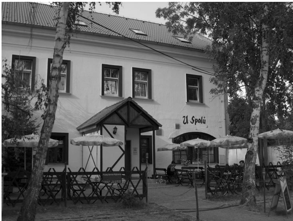
Restaurace U Spalů dnes

Otevírací doba: Po - Pá: 12 - 23 hodin So - Ne: 11 - 23 hodin