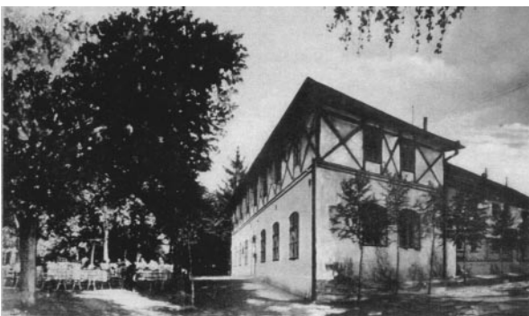
Restaurace z roku 1930